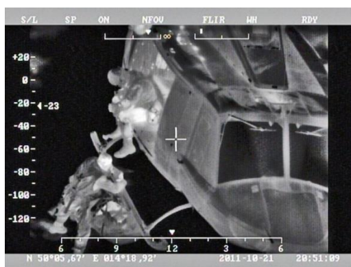
Evakuace zraněné osoby pomocí vrtulníku