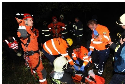
Postup záchranářů na místo nálezu osoby a poskytnutí první pomoci