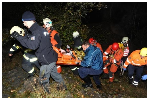
Přesun pozemní cestou