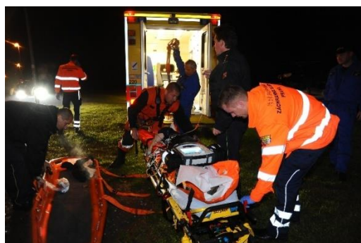
Předání zraněné osoby do rukou zdravotníků