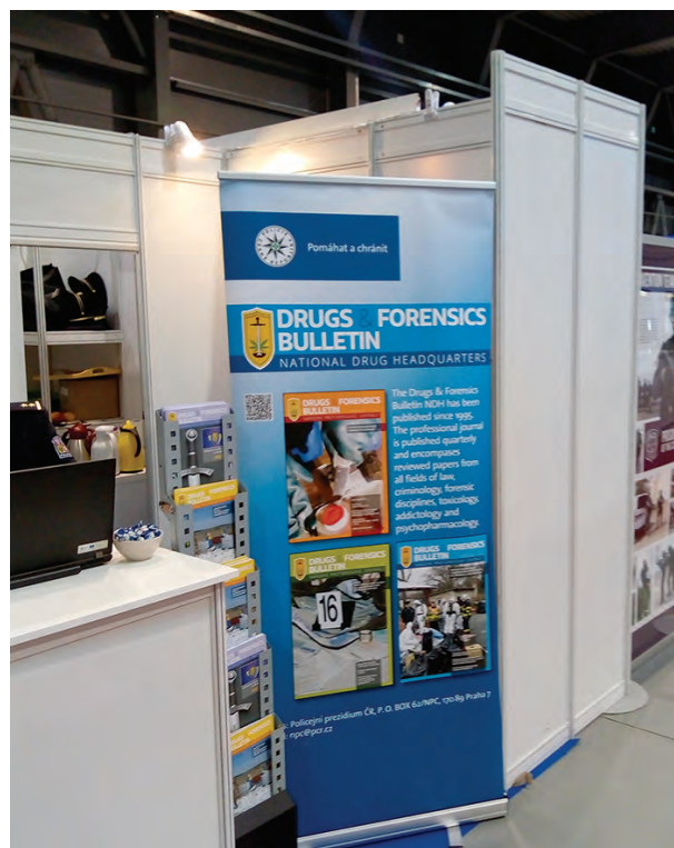
Obr. 3 – Stánek Policie České republiky s roll-up Drugs & Forensics

V neposlední řadě zmíníme stánek Policie České republiky, kde se mohli účastníci seznámit s prací policistů různých útvarů s celostátní i vymezenou působností, výbavou pyrotechniků, elektrickým automobilem určeným pro letiště Praha. Své zastoupení zde měla i Národní protidrogová centrála a odborný časopis Drugs & Forensics Bulletin NPC .