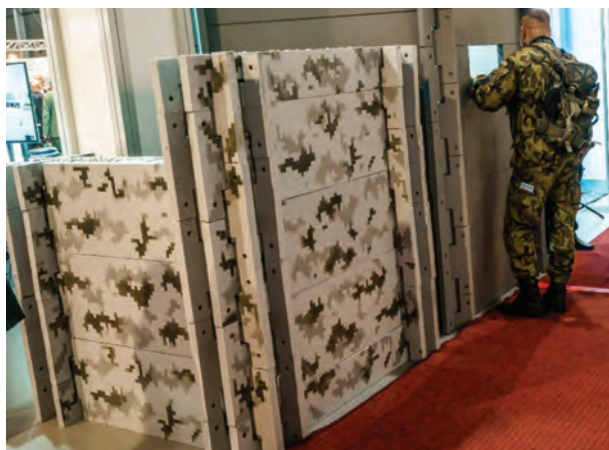
Obr. 2 – Mobilní bariéra balisticky odolného betonu od ČVUT v Praze

Své zastoupení zde měla také společnost zabývající se osobními ochrannými prostředky. Jednalo se o oděvní součástky a ochranu dýchacích cest, očí, uší na různé úrovni ochrany. Jistě by našly své uplatnění u příslušníků ozbrojených bezpečnost sborů v souvislosti se vstupy a prováděním procesních úkonů v nelegálních laboratořích na výrobu metamfetaminu či v pěstírnách konopí. Zástupce společnosti dokázal podat odborné informace o používání specifických filtrů proti jednotlivým nebezpečným chemickým látkám a poradit adekvátní úroveň ochrany zdraví jedince. Je třeba rovněž zmínit vystavovatele, který, mimo jiné, prezentoval možnosti dekontaminace a vývoj speciálních podlahovin vykazující vysokou odolnost proti působení bojových chemických látek. Dále prostředky pro provádění jednoduché dekontaminace menších prostor a dopravních prostředků, ale i možnosti odmořit velká veřejná prostranství s komplikovaným přístupem (tunel metra, nástupiště). České vysoké učení technické v Praze představilo mimo jiné, nápaditý způsob řešení ochrany policistů či vojáků. Jednalo se o možnost budování mobilních bariér a krytů z balisticky odolného betonu, který je schopen odolat palbě z ručních zbraní a účinkům výbuchu. Přímou na místě byl pro představení k vidění sestavený bezpečnostní check-point.