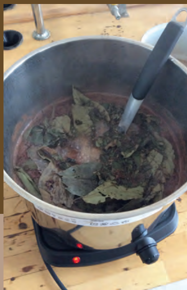
AYAHUASCA – PSYCHOAKTIVNÍ AMAZONSKÝ NÁPOJ