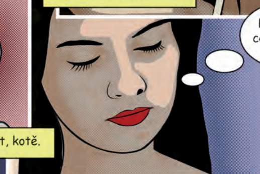
Obr. 1 – Sexuální motiv online sexuálního nátlaku a vydírání dětí