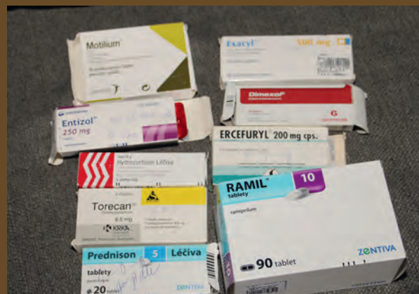
CHYŤ MĚ, KDYŽ TO DOKÁŽEŠ – NELEGÁLNÍ PRODEJ FARMACEUTIK NA INTERNETU