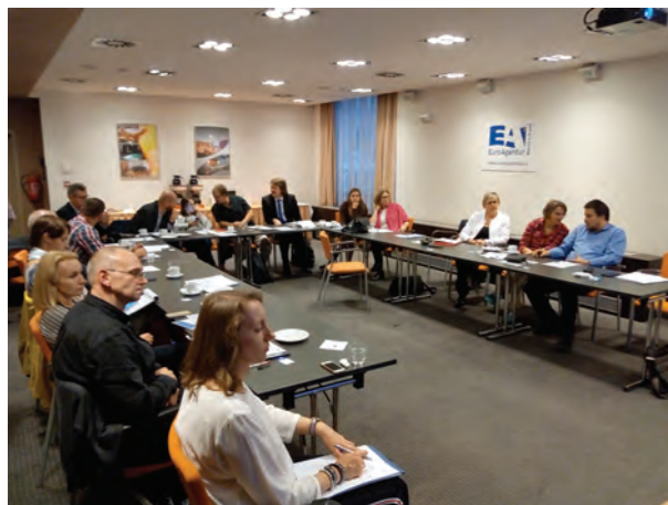
Obr. 3 – Fotografie s účastníky během konference EMPACT

The International Conference held in Prague EMPACT 2018, which was attended by Czech and foreign participants from the ranks of the police and forensic expertise, professional workplaces, has brought a variety of new knowledge, information and evaluation of past activities. At the same time were changed on the professional level from the individual member representatives to exchange expertise and experience in the detection, investigation and classification of new psychoactive substances.