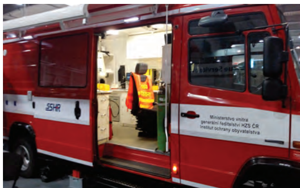
Obr. 1 – Vozidlo HZS ČR

Své zastoupení zde měla také společnost zabývající se osobními ochrannými prostředky. Jednalo se o oděvní součástky a ochranu dýchacích cest, očí, uší na různé úrovni ochrany. Jistě by našly své uplatnění u příslušníků ozbrojených bezpečnost sborů v souvislosti se vstupy a prováděním procesních úkonů v nelegálních laboratořích na výrobu metamfetaminu či v pěstírnách konopí. Zástupce společnosti dokázal podat odborné informace o používání specifických filtrů proti jednotlivým nebezpečným chemickým látkám a poradit adekvátní úroveň ochrany zdraví jedince. Je třeba rovněž zmínit vystavovatele, který, mimo jiné, prezentoval možnosti dekontaminace a vývoj speciálních podlahovin vykazující vysokou odolnost proti působení bojových chemických látek. Dále prostředky pro provádění jednoduché dekontaminace menších prostor a dopravních prostředků, ale i možnosti odmořit velká veřejná prostranství s komplikovaným přístupem (tunel metra, nástupiště). České vysoké učení technické v Praze představilo mimo jiné, nápaditý způsob řešení ochrany policistů či vojáků. Jednalo se o možnost budování mobilních bariér a krytů z balisticky odolného betonu, který je schopen odolat palbě z ručních zbraní a účinkům výbuchu. Přímou na místě byl pro představení k vidění sestavený bezpečnostní check-point.