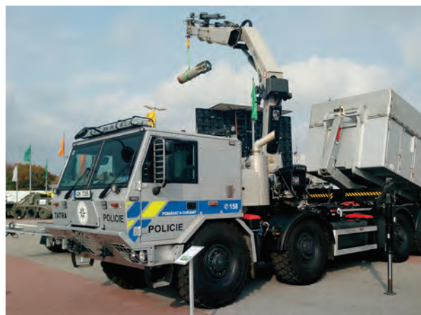
Obr. 4 – Těžká automobilní technika Policie České republiky

Venkovní expozice nabízela k ukázkám mobilní a těžkou techniku základních i ostatních složek integrovaného záchranného systému, jako vrtulníky, tanky, obrněné transportéry, nákladní automobily, obranné vozidlo Božena, mobilní techniku zdravotníků a další.