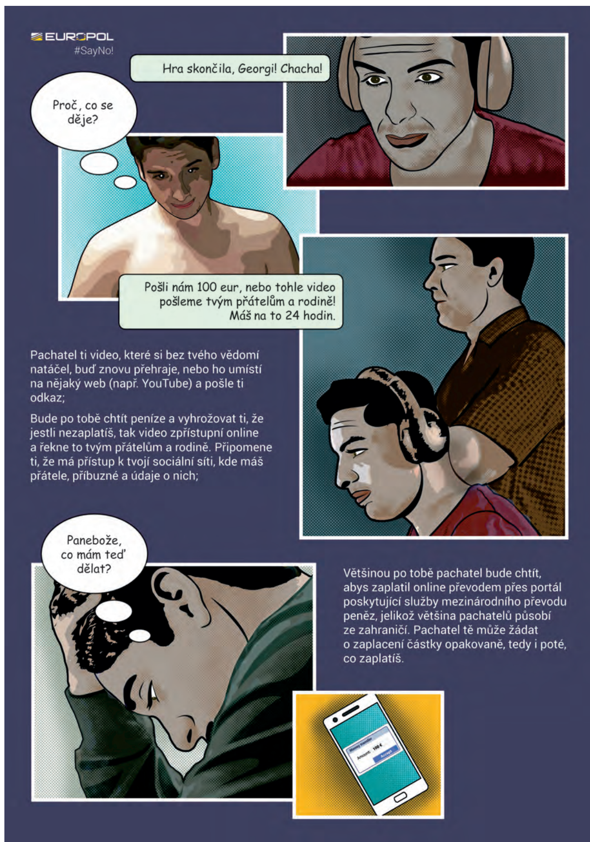
Obr. 3 – Finanční motiv online sexuálního nátlaku a vydírání dětí – strana 2