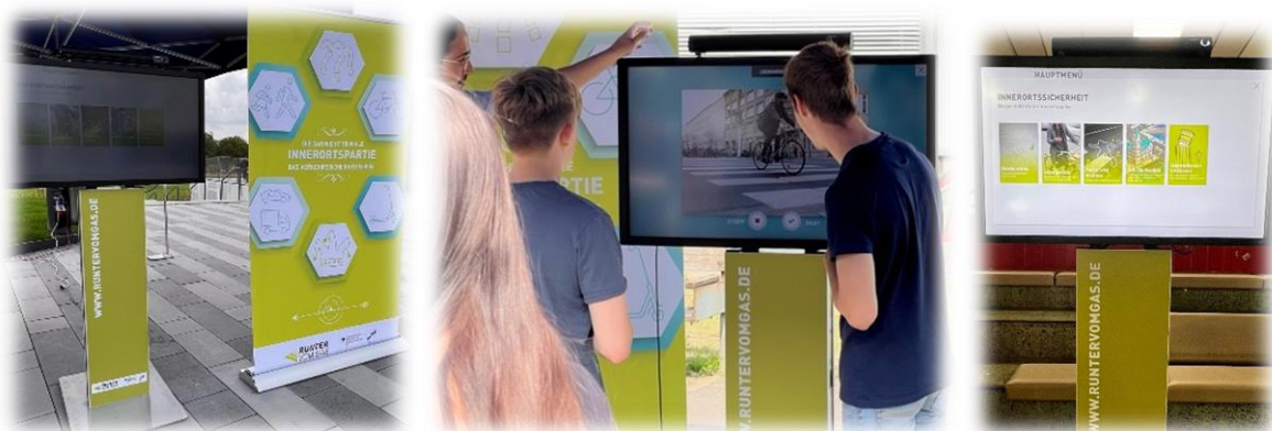
(Use of the multi-media column)

At the multi-media pillar, workshop participants can experience live digital hands-on activities. Inappropriate speed, distraction and safety in built-up areas are just a few of the topics that users can learn about in a playful way.