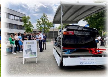
(Einsatz des Unfall-Pkw bei BOB-Workshops)

Bei vielen BOB-Veranstaltungen oder Workshops steht der zerstörte Toyota als eindrucksvolle Mahnung für rauschfreies und risikobewusstes Fahren.