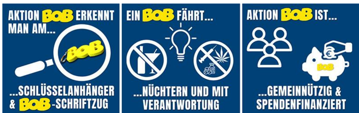
(Die wichtigsten Merkmale der Aktion BOB auf einen Blick)

Über Risiken und Gefahren im Straßenverkehr informiert die Aktion BOB und sensibilisiert und stärkt dabei das Verantwortungsbewusstsein der jungen Verkehrsteilnehmenden: Ein BOB übernimmt in einer Gruppe junger Fahrerinnen und Fahrer die Verantwortung für sicheres Fahren. Am Steuer verzichtet ein BOB auf Alkohol, Drogen oder andere berauschende Mittel und geht bewusst mit den Gefahren und Risiken des Straßenverkehrs um. Freunde und sich selbst bringt ein BOB sicher ans Ziel. Dank eines BOB können die Übrigen feiern und trinken.