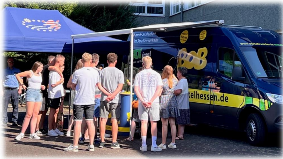
(Schülerinnen und Schüler informieren sich an einem BOB-Stand)

Wildunfällen sowie den Gefahren illegalen Tunings. Alle unterschiedlichen Themen werden zeitgemäß und zielgruppenorientiert dargestellt und es bleibt Raum für Fragen der Workshop-Teilnehmerinnen und -Teilnehmer. Unterstützt werden die unterschiedlichen Themenfelder durch eine Auswahl von speziellen Verkehrs-Videos, welche die Emotionen der jungen Fahrerinnen und Fahrer ansprechen und teilweise „unter die Haut gehen“.