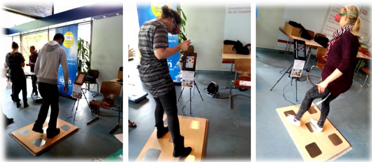
(Einsatz eines Agility-Boards im Rahmen eines BOB-Workshops)

Mit dem Agility-Board, einem interaktiven Reaktionstestgerät, lassen sich ebenso eindrucksvolle und intensive Szenarien von Auswirkungen auf das Reaktionsvermögen mit und ohne Rauschbrille darstellen.