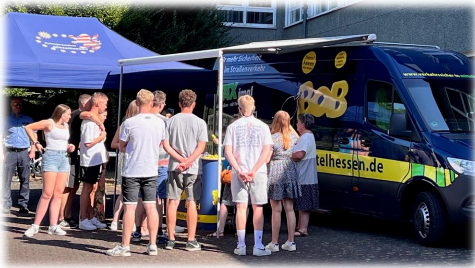
(Pupils get information at a BOB stand)

Basically, the BOB workshops cover the entire range of topics, with the focus remaining on the dangers of alcohol and drugs in road traffic. In addition, it is possible to set different focal points for each workshop together with the organiser, depending on the target audience.