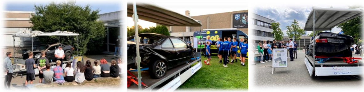
(Use of the accident car at BOB workshops)

At many BOB events or workshops, the destroyed Toyota stands as a forceful reminder for noise-free and risk-conscious driving.