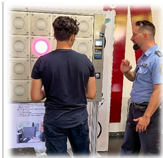
(Reaktionswand im Einsatz bei einem BOB-Workshop)

Umso schneller die Lichter ausgedrückt werden, umso besser ist die Reaktionszeit des Teilnehmers. Insbesondere beim Vergleich der erzielten Reaktionswerte mit und ohne Rauschbrille ergeben sich spannende und wiederum nachhaltige Momente.