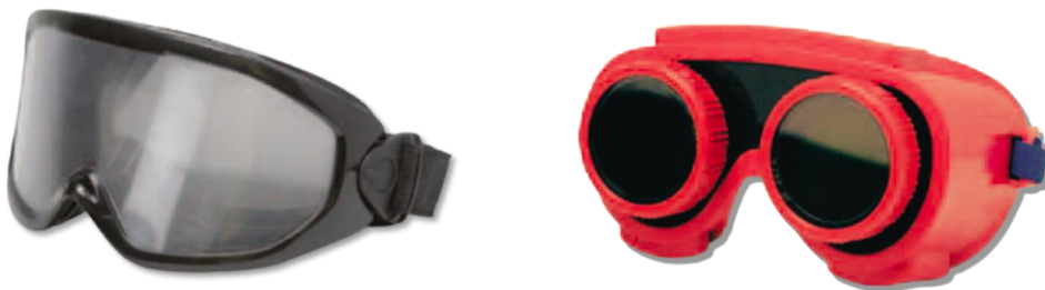
(Different intoxication goggles simulate effects of alcohol or drugs)

It becomes interactive for the participants when intoxication goggles are used in the BOB workshop. These actively stimulate the senses and show in a harmless but impressive way the inevitable effects of intoxication through alcohol or drug consumption on the ability to react.