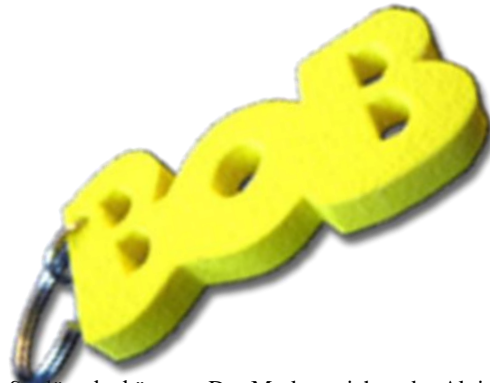
(BOB-Schlüsselanhänger - Das Markenzeichen der Aktion BOB)

Die BOB-Idee setzt sich aus dem auffälligen gelben BOB-Anhänger mit Mehrwertfunktion, einem Workshop, dem Bekenntnis zur Verantwortungsübernahme und weiteren Bestandteilen zusammen.