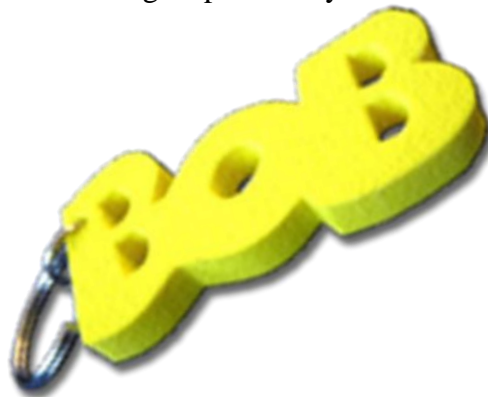
(BOB Keychain - The trademark of Aktion BOB)

The BOB idea is made up of the eye-catching yellow BOB keychain with added value function, a workshop, a commitment to taking responsibility and other components.