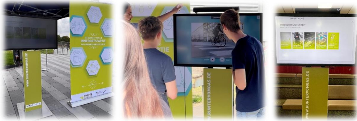
(Einsatz der Multi-Media-Säule)

An der Multi-Media-Säule wiederum können die Workshop-Teilnehmenden digitale Mitmach-Aktionen live erleben. Unangepasste Geschwindigkeit, Ablenkung und Innerortssicherheit sind nur einige der Themen, welche sich den Nutzern teilweise spielerisch erschließen.