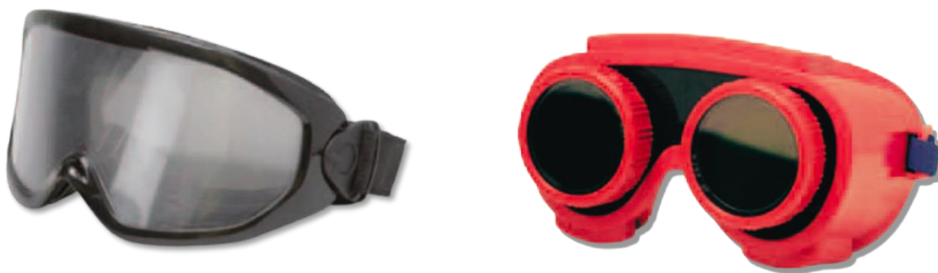
(Unterschiedliche Rauschbrillen simulieren Auswirkungen von Alkohol oder Drogen)

Interaktiv wird es für die Teilnehmenden, wenn im BOB-Workshop die Rauschbrillen zum Einsatz kommen. Damit werden die Sinne aktiv angesprochen und zeigen auf ungefährliche, aber eindrucksvolle Weise, die unabwendbaren Auswirkungen von Rauscheffekten durch Alkohol- oder Drogenkonsum auf das Reaktionsvermögen.