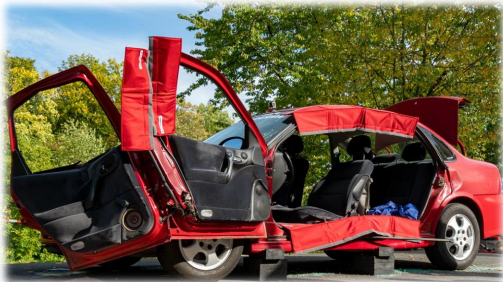
nach Einsatz der Rettungsschere)

In den Jahren 2006 und 2007 gab es dabei fünf Unfalltote, 84 Schwerverletzte und 229 junge Menschen erlitten leichtere Verletzungen. Diese Zahlen waren deutlich höher, als der Anteil dieser Altersklasse es statistisch erwarten ließ. Für die Polizei bestand akuter Handlungsbedarf, damit die traurigen Zahlen schnell und deutlich zurückgehen.