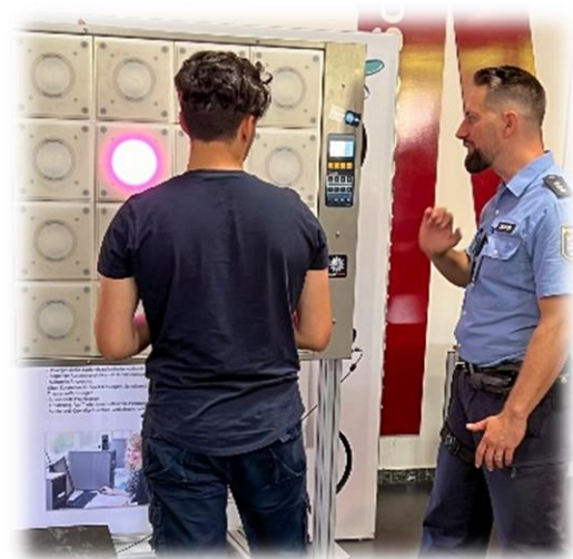
(Reaction wall in use at a BOB workshop)

Different elements react optionally in a pre-programmed or random order, position and speed. The task is always the same. The buttons must be deactivated by touching them briefly and quickly. Every mistake is registered by the device and presented to the participant in an evaluation at the end.