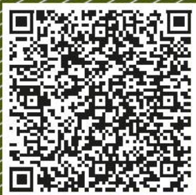
Zajišťování virtuálních aktiv pocházejících z drogové trestné činnosti