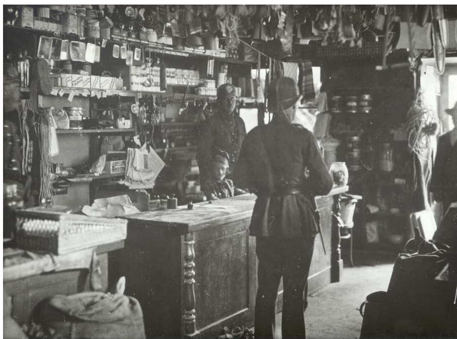
Místo činu pokusu loupežné vraždy v Budči u Běchovic, 14.9. 1928

Potřeba zkvalitnění pátrací služby i snaha po samostatnosti v oblasti kriminalistiky v činnosti četnictva vedla totiž v roce 1922 ke zřízení zvláštního četnického oddělení u poznávacího úřadu Policejního ředitelství v Praze. V roce 1927 se osamostatnilo a pracovalo jako Ústřední četnické pátrací oddělení v objektu Zemského velitelství pro Čechy v Praze, Karmelitské ulici. Podle obsahu činnosti se dělilo na skupiny daktyloskopickou, fotografickou, specializace pachatelů, kriminální evidence, evidence cikánů a lupičů pokladen, korespondence, zpráv a bezpečnostního rozhlasu, organizační a studijní skupinu, která řídila chov, výcvik a používání služebních psů. Ústřední četnické pátrací oddělení bylo vrcholným orgánem kriminalistické služby četnictva a celý jeho další vývoj znamenal prestižní a kompetenční boj s Všeobecnou kriminální ústřednou. Vznik a další vývoj Všeobecné kriminální ústředny se totiž stal vlastně organizační záležitostí pražského bezpečnostního oddělení, aniž se tím kriminální službě z hlediska celostátního pronikavě pomohlo.