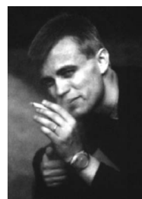
Václav HRABĚ (13.6. 1940 – 5.3. 1965)

Retrospektivní sbírku B. obrazů vlastní Muzeum současného umění v Los Angeles.