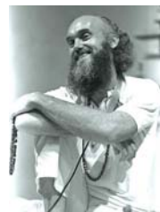
Richard Alpert (1931nebo 1933 )

přeměroval z drog na počítačové technologie, až do své smrti byl označován na „gurua LSD“.