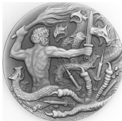
NÁRODNÍ PROTIDROGOVÁ CENTRÁLA 2001 ražený tombak 60mm razila firma TRIGA PRAHA