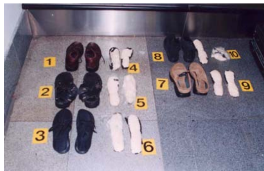
2,1 kg kokainu – letiště - Ruzyně březen 2002

V ostatních případech se jednalo o gramová množství, kdy tato OPL byla přepravována letecky zejména v poštovních zásilkách nebo byla nalezena u osob cestujících osobními vozidly a autobusy z Holandska, kteří si jí dováží ze svých "drogových výletů" do Holandska.