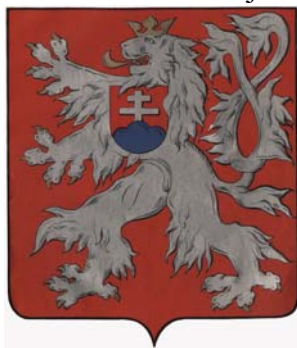
Malý státní znak Republiky Československé

A že se nejednalo o problém druhořadý je nasnadě. 26. 11. 1919 adresovalo