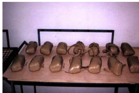
14 kg efedrinu na hraničním celním přechodu Mikulov – červen 2002