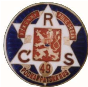
Odznak vydaný na Podkarpatské Rusi

Nový odznak civilní stráže nebo-li neuniformovaného sboru stráže bezpečnosti byl tedy na světě a to zcela oficiálně. Jednalo se o kruhový odznak (dosud jsou znám tři základní velikosti a to 33, 38 a 44 mm v průměru - pozn. aut) na zpravidla mosazném, mírně vypouklém podkladu, který byl vzadu opatřen sponou. Na odznaku byla na modrém smaltovaném podkladu bílá šesticípá hvězda v níž byl na štítu malý státní znak. Ve třech hrotech hvězd jsou pak písmena R Č S, dolním hrotu je pak umístěno pořadové číslo. Odznak byl opatřen nápisem výkonný polic. orgán a názvem města, v jehož působnosti byl sbor zřízen. Provedení odznaku bylo velice kvalitní jak po stránce dílenského zpracování, tak po stránce grafické a heraldické. Odznak byl jasný, zřetelný a dobře čitelný. Jednotlivé odznaky se mohly lišit velikostí a samozřejmě i výrobcem. Mezi nejznámější výrobce pak patřila firma Karnet a Kyselý a mezi úplně první pak pražská firma J.B.Pichl, která odznaky pro pražské policejní ředitelství vyráběla (byť bez