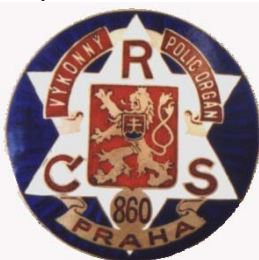
Jeden z prvních zavedených odznaků u nás

Velkým pozitivem bylo, že v době, kdy byla tato připomínka psána byl již na světě zákon č. 252/1920 Sb. Z. a n. kterým se vydávaly ustanovení o státní vlajce, státních znacích a státní pečeti. Na přelomu let 1920 – 1921 bylo konečně povoleno ministerstvem vnitra aby byla civilní stráž vybavena služebním odznakem, jehož podklad „... by bylo vzíti malý státní znak republiky Československé...“ právě ve smyslu shora uvedeného zákona. Na červeném štítě měl být umístěn stříbrný lev, který chová na prsou znak Slovenska. Toto povolení bylo patrně mimo jiné přímou reakcí na události z prosince 1920, kdy během masových demonstrací v Praze i na venkově „...byli civilní strážníci na životě ohrožováni a tak opatření pro civilní stráž ukázalo se nutným...“ Tím začalo prakticky docházet k zavádění nového odznaku pro civilní stráž.