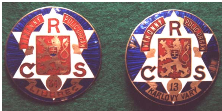
Další odznaky výkonných policejních orgánů, vydaných jinými státními policejními úřady.

Jinou otázkou bylo používání podobných odznaků různými komunálními policejními sbory, to je ovšem samostatně zpracovaným tématem a bude se jím zabývat některé z dalších pokračování.