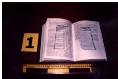
2,4 kg hašiše ukryté v knize – letiště - Ruzyně – říjen 2002