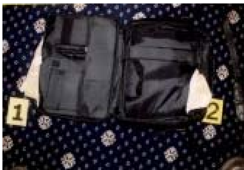
2 kg kokainu – letiště - Ruzyně listopad 2002

Mezi největší záchyty patří zadržení dvou leteckých kurýrů s přibližně stejným váhovým množstvím této drogy na letišti Praha-Ruzyně. V prvním případě se jednalo o občana polské národnosti, který cestoval letecky na trase Cordoba - Sao Paulo - Paříž - Praha a u kterého bylo nalezeno 2,1 kg kokainu ukrytého v podrážkách bot uložených v cestovních zavazadlech. Ve druhém případě byl zadržen občan SRN cestující letecky na trase Amsterdam-Praha. U tohoto občana byla v jeho cestovním zavazadle nalezena černá kožená příruční taška s hygienickými potřebami. Ve stěnách této tašky pak bylo nalezeno 2 kg kokainu.