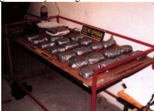
12 kg marihuany – hraniční celní přechod Mikulov – září 2002

Nejčastějším místem záchytu drog již tradičně a naprosto jednoznačně zůstává letiště Praha - Ruzyně. V roce 2002 zde byly celními orgány zachyceny OPL celkem ve 180 případech, což z celkového počtu záchytů v celé České republice představuje 61 %. Oproti roku 2001 mírně vzrostl počet případů záchytů drog na ostatních hraničních celních přechodech (dále jen HCP). Zatímco v roce 2001 byla na těchto místech odhalena přeprava OPL zhruba v 16 % případů (63 z 402), v roce 2002 se jednalo přibližně o 30 % případů (92 z 313). Tento nárůst je ve značné míře způsoben, jak již bylo zmíněno, věnováním větší pozornosti autobusové přepravě. Z hlediska počtu záchytů i množství zadržených drog na HCP stojí dále za zmínku 50 záchytů drog na CÚ Rozvadov (zejména v autobusech) a 2 případy na CÚ Mikulov, při nichž bylo zachyceno více jak 12 kg marihuany a 14 kg efedrinu.