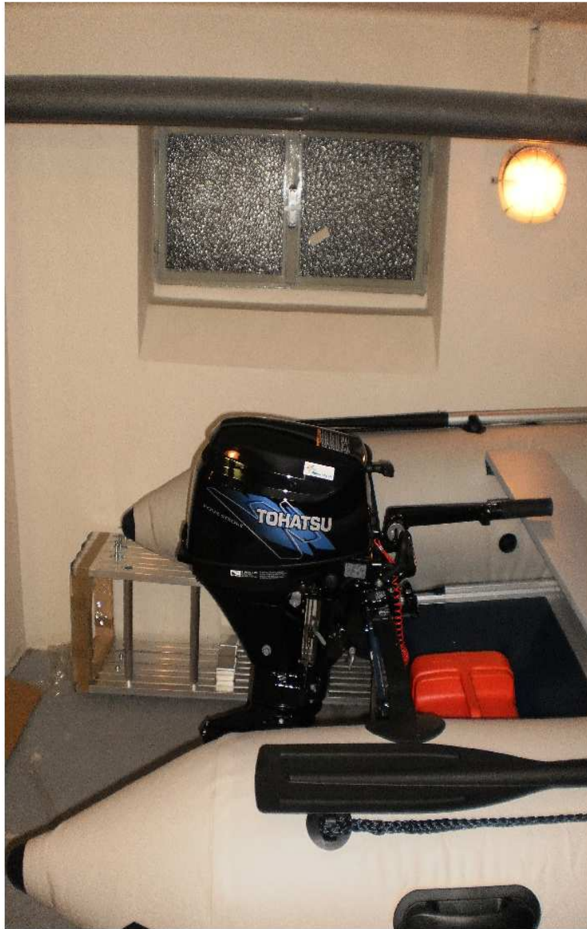
lodní motor TOHATSU