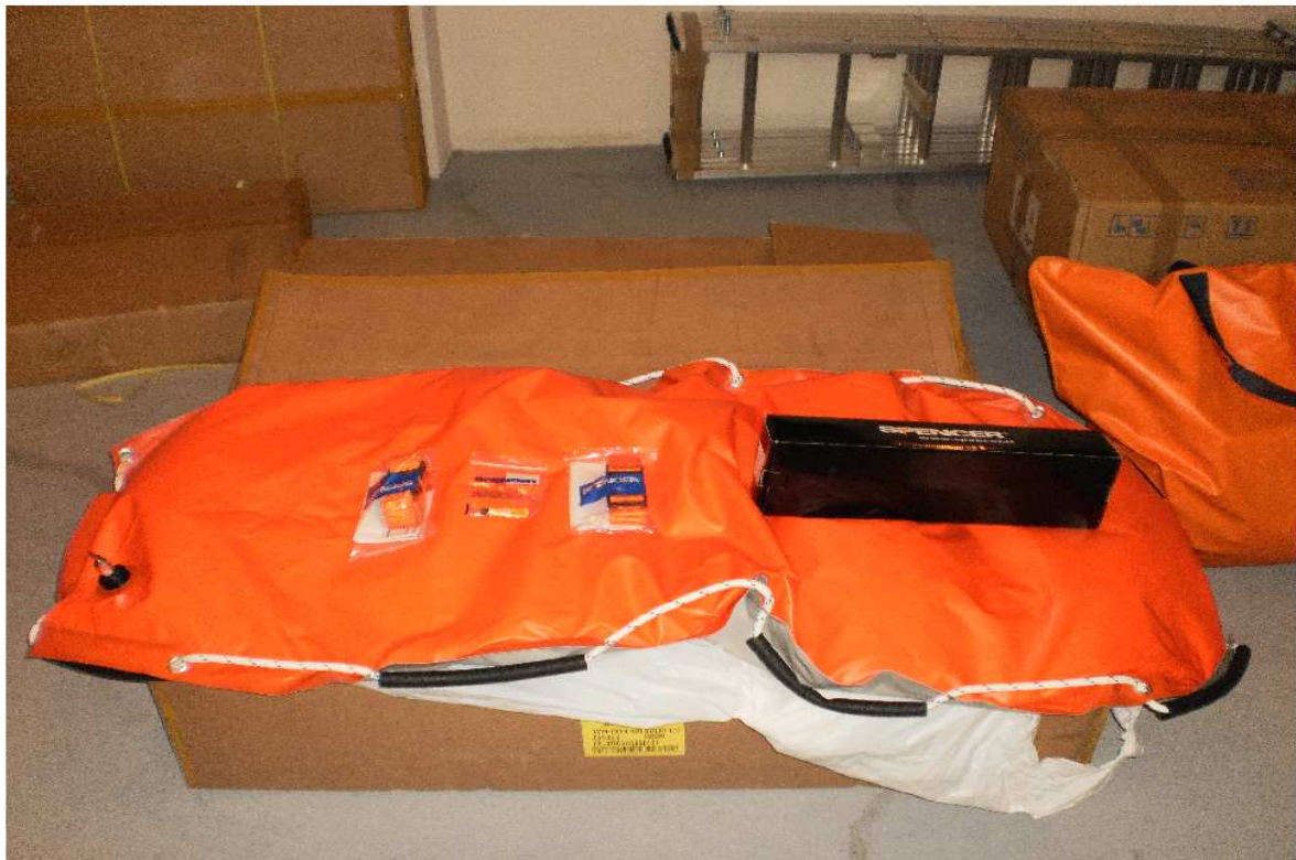
vakuová matrace detail