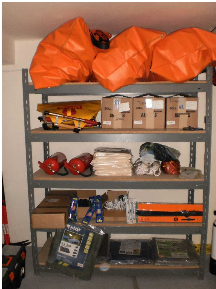
pohled na uložené věci