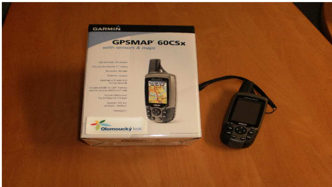
Garmin GPSMAP 60CSx