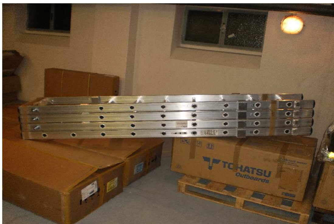
požární žebřík detail