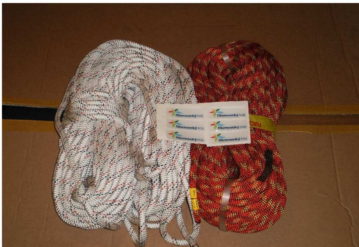
statické a dynamické lano