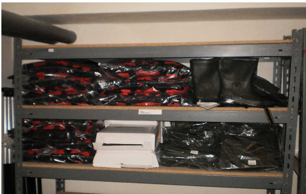
plovací vesty a brodicí kalhoty