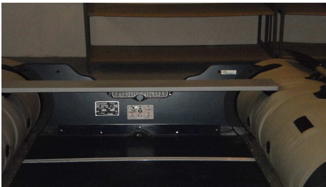
člun TYPHOON detail