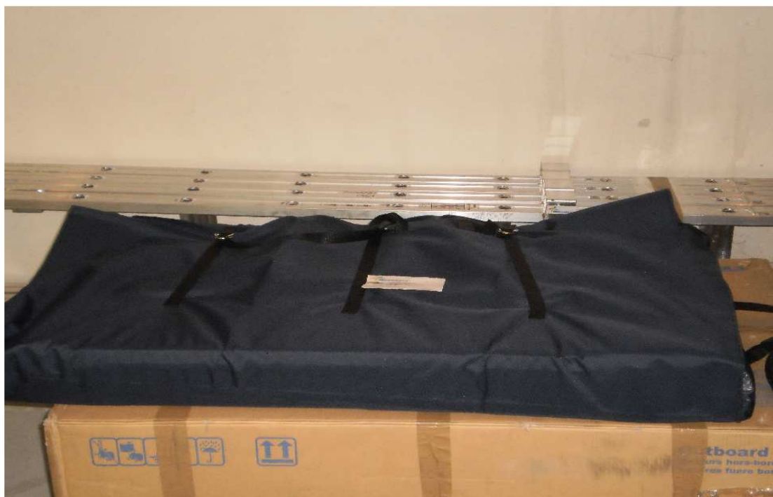
podlaha člunu TYPHOON