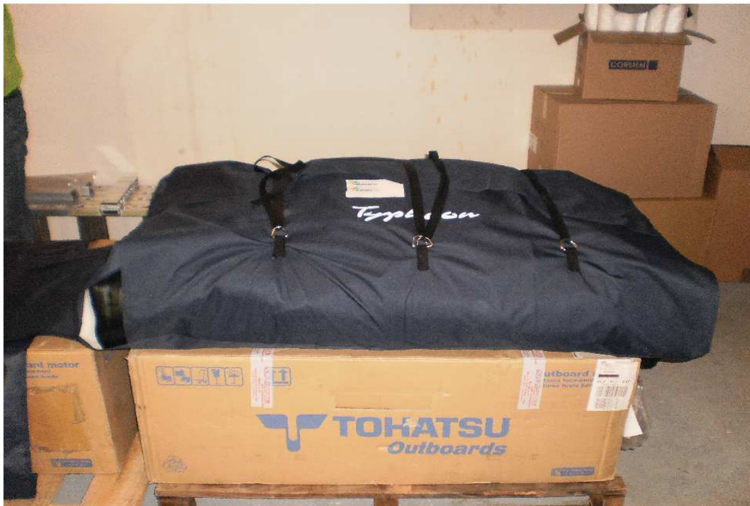
Složený člun v přepravním vaku