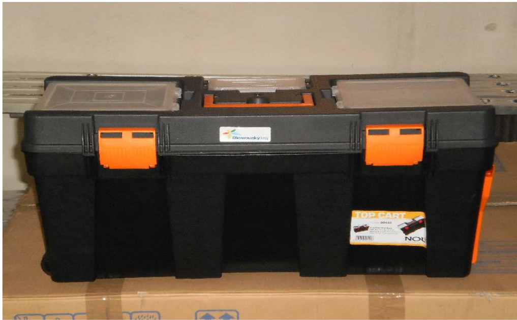
box na nářadí