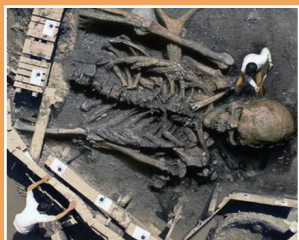
Lidí vás podvádí!