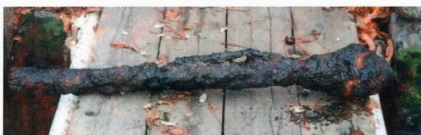
„Panzerfaust“, nalezený potápěči v roce 2000 v Praze ve Vltavě u mostu Legií. I když na to nevypadá, mohl ještě vybuchnout...

Zbraní, munice a jiných podezřelých nálezů se nedotýkejte.