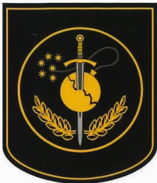
Znak pyrotechnické služby Policie ČR.