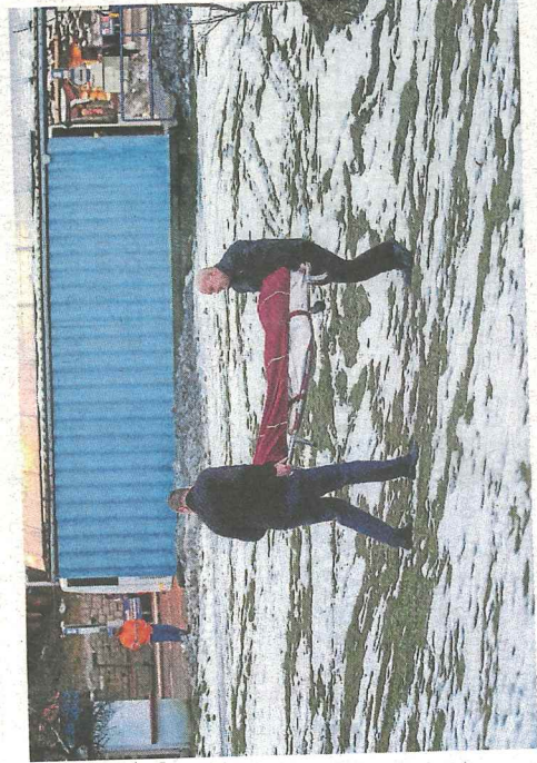
PODEŽŘELÁ SMRT muže. V Jablonci nad Nisou v pondělí odpoledne našli tělo bez známek života v opuštěném objektu u autobusového nádraží.

psal hrůzný nález jeden z desetiletých chlapců s tím, že zavolali na třetího kamaráda a společně pak svůj objev oznámili policistům. Na místo přijeli s policisty i profesionální hasiči a posádka zdravotníků Zdravotnické záchranné služby Libereckého kraje (ZZS LK). „Konstatovali jsme smrt a v součinnosti s policií je nařízena soudní pitva“, potvrdil mluvčí ZZS LK Michael Georgiev. Podle zavedených pravidel je tato soudní pitva nařízena vždy při každém úmrtí „mimo domov“, nemusí se tak v každém případě jednat o násilnou smrt. Přestože svědci to v tomto případě svou výpovědí na-