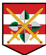
KRAJSKÉ ŘEDITELSTVÍ POLICIE JIHOVMORAVSKÉHO KRAJE

Samotná hrozba jakékoli sociální sítě nespočívá v její existenci jako takové, ale vždy v chování jednotlivých uživatelů. Jde o to, jak zodpovědně se daný uživatel na sociální sítí chová, jaké informace o sobě zveřejňuje a jaký materiál dává k dispozici do veřejného prostoru. Při nezodpovědném užívání jakékoli sociální sítě hrozí ztráta soukromí, únik osobních a citlivých údajů a případné zneužití.