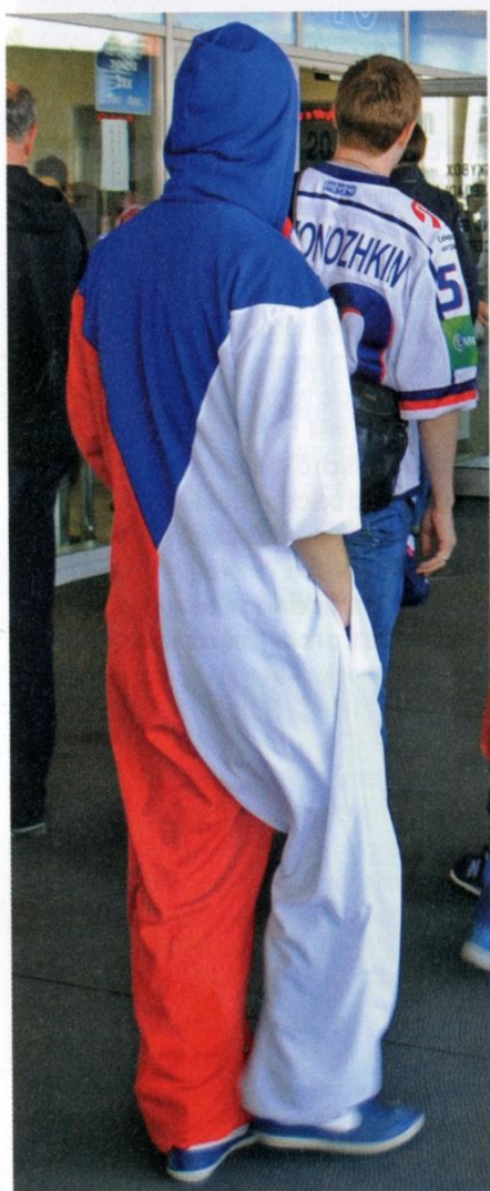
Někteří čeští fanoušci byli opravdu originální.

Sedmnáct květnových dní žila Česká republika hokejem. Fanoušci si nadšeně užívali zápasů. Zaplňovali obě hokejové arény, jak v Praze, tak i v Ostravě, a vytvářeli tam skvělé publikum. Naše republika má nový rekord v návštěvnosti, hokejová utkání navštívilo více než 740 tisíc diváků.