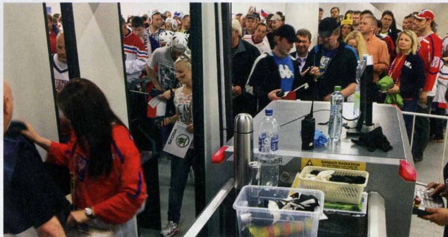
Bezpečnostní prohlídky při vstupu na stadion byly důkladné. Fanoušci většinou neprotestovali.