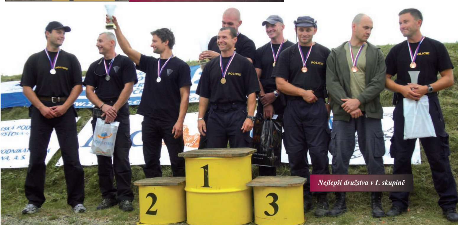
Nejlepší družstva v I. skupině