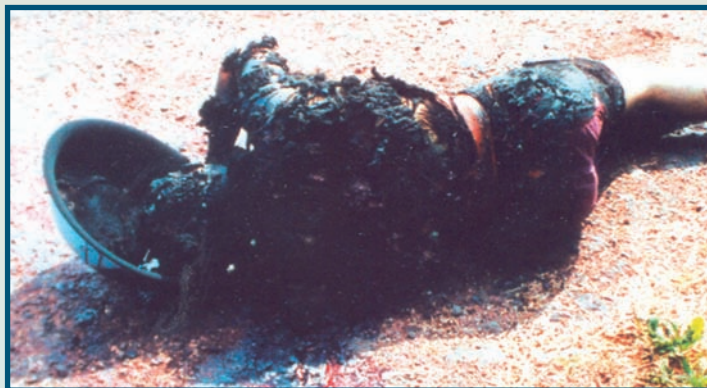
Nedaleko vrat hřbitova v obci Vrchovina leželo ohořelé tělo bílého koně

Fakturanti se stali v určité části společnosti doslova hitem. „Vy ještě nemáte svého koně?“ divila se jedna rodina druhé. Výhody, aspoň dočasné, pochopila i bílá majorita, bílí koně tak začali figurovat i v případech celních podvodů s lehkým topným olejem či alkoholem. Stejně tak se s nimi můžeme setkat jako s nastrčenými šefy úmyslně krachujících či tunelovaných firem.