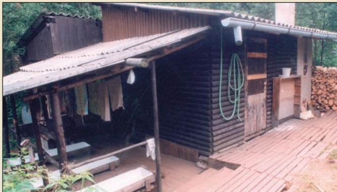
Další tělo bílého koně leželo bezmála půl roku pod podlahou sauny dětského tábora ve Verněřovicích