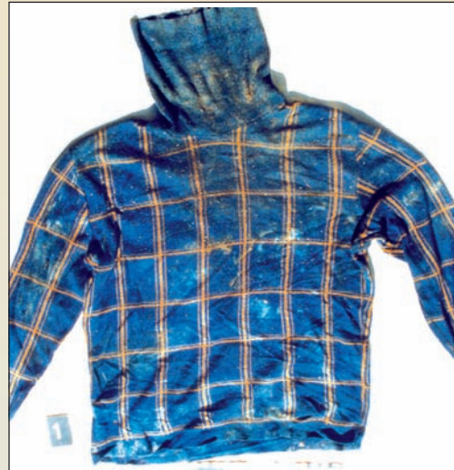
Ztotožnění Milana Volfa probíhalo porovnáním spodní čelisti s kartou zubního lékaře a také podle oblečení či obutí.