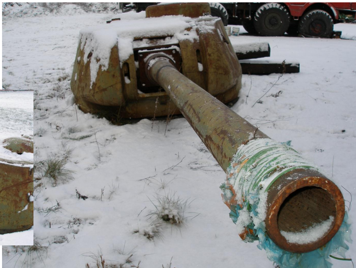
Tankový kanon – vzor 44/85, ráže 85 mm, umístěný v samostatné tankové věži. pracoviště Karviná