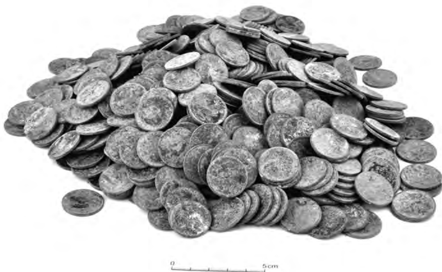
Obr. 4. Roztoky u Jilemnice na parc. č. 156. Stav mincí před konzervací.

vových předmětů uložený do země buď již v roce 1938, nebo krátce po tomto roce. Ukrytí nálezů patrně souviselo s odsunem českého obyvatelstva ze Sudet na podzim roku 1938 a není vyloučeno, že se tak stalo ještě před zahájením 2. světové války. Roztoky sice zůstaly po zabrání Sudet nadále součástí Československé republiky, ale obava z nastalé situace určitě panovala.