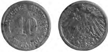
NĚMECKO, Vilém II. (1888–1918), Berlín, 10fenik 1896