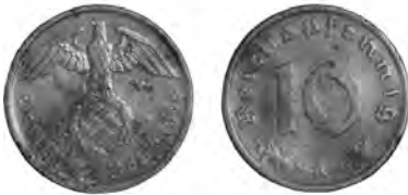
NĚMECKO, Berlín, 10 říšských feniků 1938