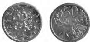
ČESKOSLOVENSKÁ REPUBLIKA, Kremnice, 50haléř 1921