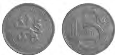
ČESKOSLOVENSKÁ REPUBLIKA, Kremnice, 5koruna 1925