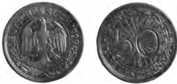
NĚMECKO, Berlín, 50 říšských feniků 1929