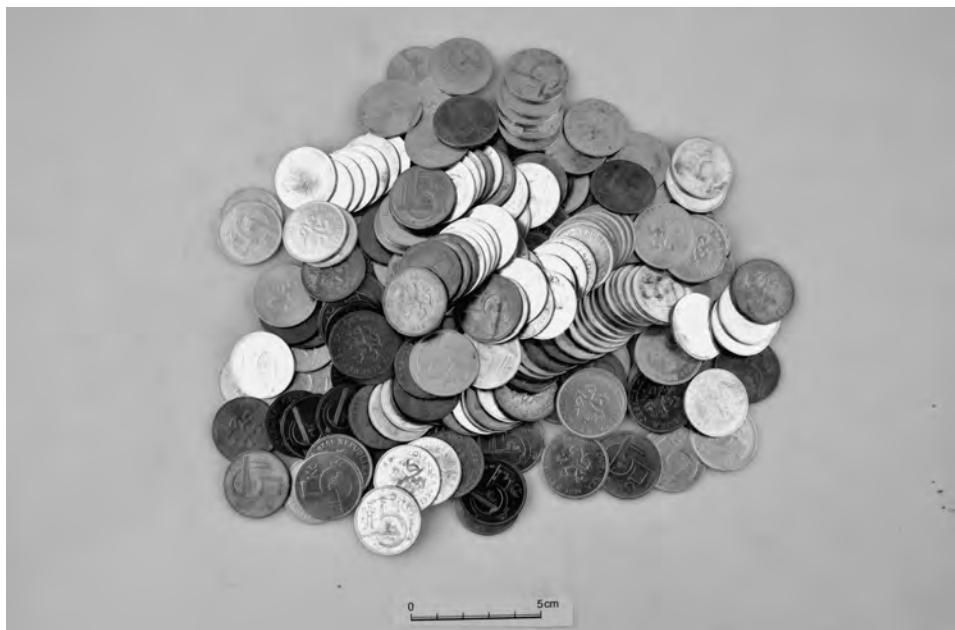
Obr. 5. Roztoky u Jilemnice na parc. č. 156. Stav mincí po konzervaci (foto Jiří Kmošek).