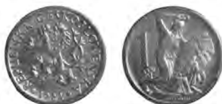
ČESKOSLOVENSKÁ REPUBLIKA, Kremnice, koruna 1922