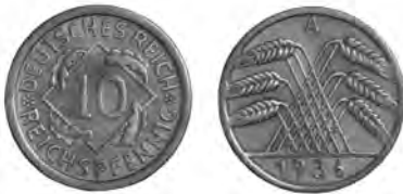
NĚMECKO, Berlín, 10 říšských feniků 1936