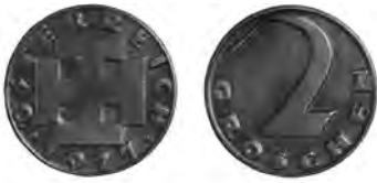
RAKOUSKO, Vídeň, 2groš 1927