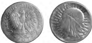
POLSKO, Vářšava, 2 złote 1934