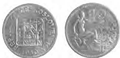
ČESKOSLOVENSKÁ REPUBLIKA, Kremnice, 10koruna 1930