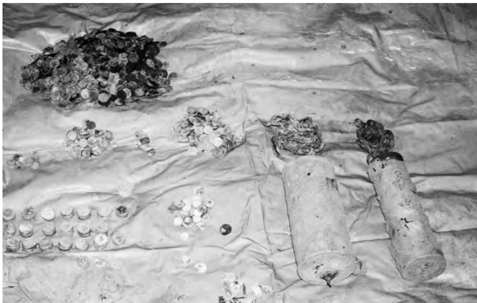
Obr. 3. Roztoky u Jilemnice na parc. č. 156. Fotografie hromadného nálezu mincí a dalších předmětů uložených v dělostřeleckém granátu (vybráno z fotodokumentace k úřednímu záznamu o nálezu vedeném pod č. j. KRPL-48049-2/ČJ-2013-181110 na obvodním oddělení Jilemnice Policie ČR, Krajského ředitelství Policie Libereckého kraje).

nálezu napovídá, že mince byly získány nahodilým sběrem a nikoliv systematickým doplňováním nějaké specializované numismatické sbírky. Jedinou raritnější mincí největšího souboru ražeb, pocházejícího z období první Československé republiky, je 50haléř 1926, jehož hodnota by se pohybovala až u hranice 10 000 Kč. To by ovšem bylo možné pouze za předpokladu, že by byl v bezvadné zachovalosti, což je označení používané pro mince, které prakticky neprošly oběhem. S každým nižším stupněm zachovalosti však hodnota takových mincí výrazně klesá, a pokud vykazují známky poškození, jsou téměř bezcenné. Uvedená mince byla spolu s ostatními ražbami v souboru pokryta korozními produkty, které výrazně narušily jejich povrch. I přes velmi pečlivou práci konzervátorského pracoviště je zřejmé, že dlouhodobé uložení nálezu v nevhodném prostředí vlhké půdy zanechalo na mincích nerasmazatelné stopy.