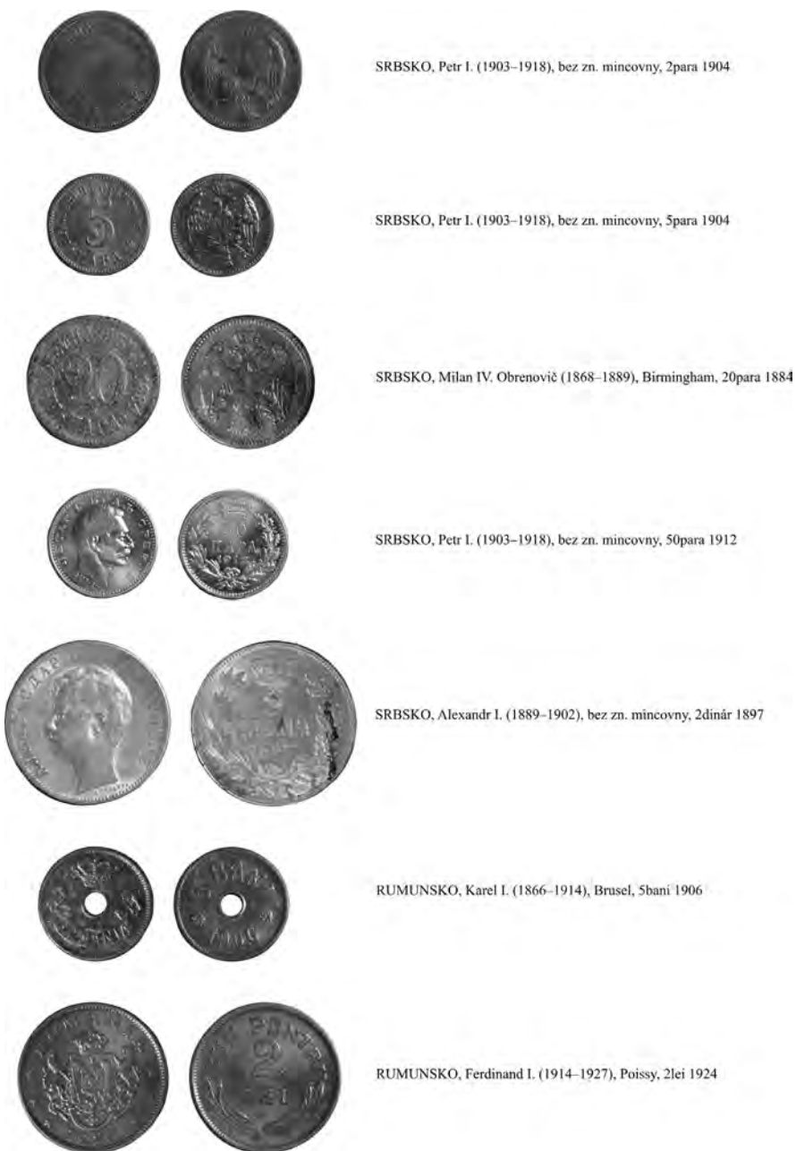
Obr. 9. Roztoky u Jilemnice na parc. č. 156 – hromadný nález mincí. Výběr mincí – SRBSKO, RUMUNSKO.