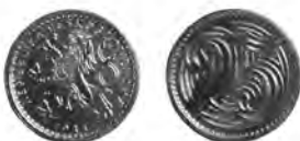
ČESKOSLOVENSKÁ REPUBLIKA, Kremnice, 25haléř 1933