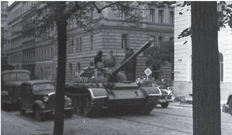
Tanky Československé lidové armády v pražských ulicích nasazené proti demonstrantům v srpnu 1969