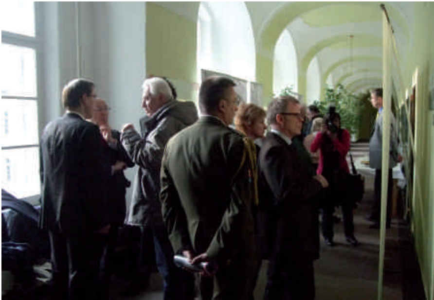
Vernisáž výstavy Nejdelsí noc – 21. 8. 1968 v Olomouci