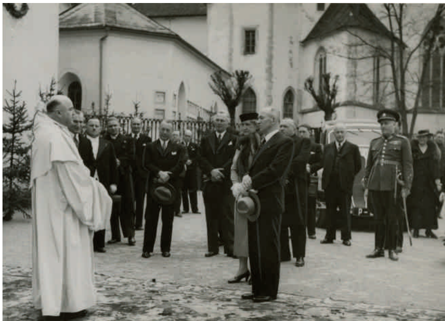
Uvítání E. a H. Benešových v klášteře Vyšší Brod, 8. 5. 1937