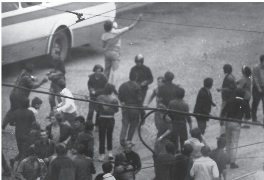
Demonstranti v srpnu roku 1969 v Praze