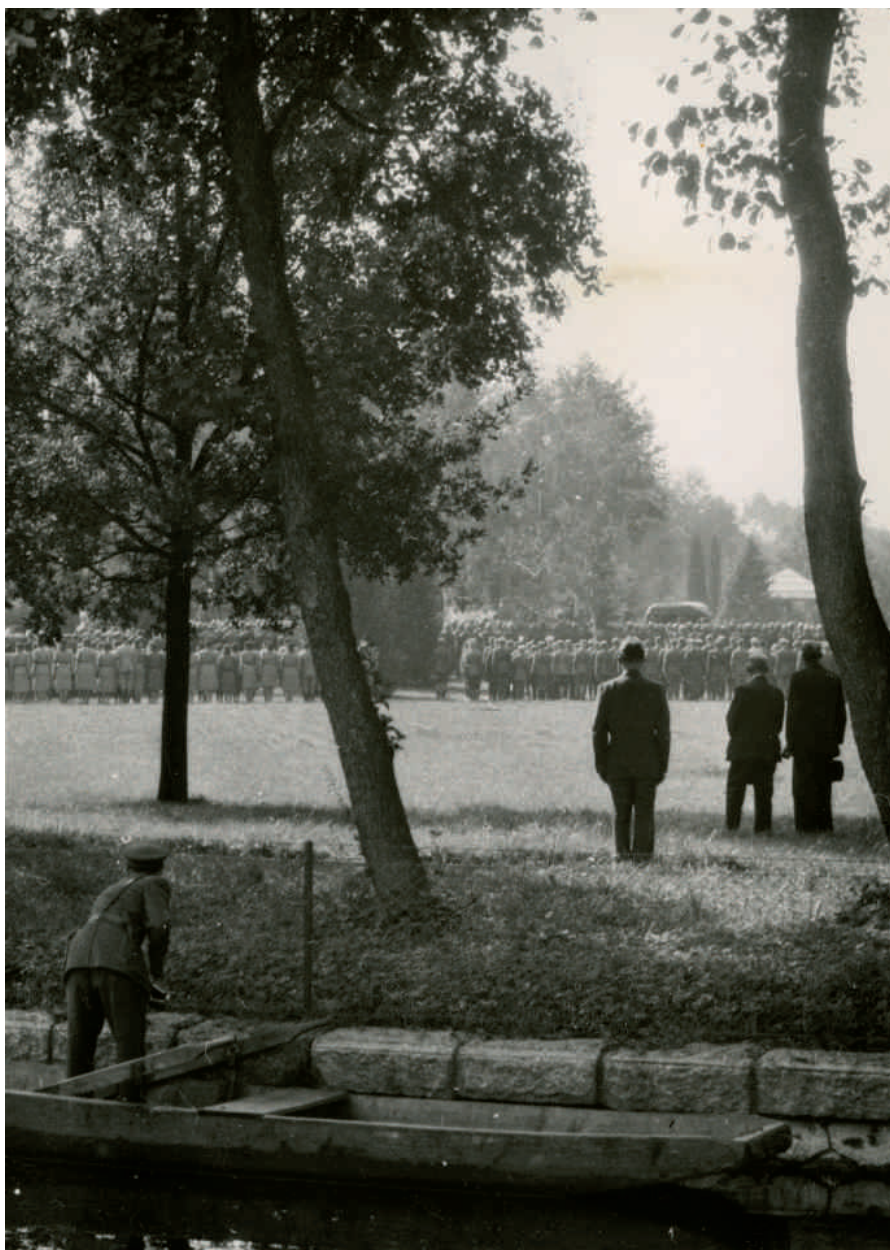
Pohřeb E. Beneše v Sezimově Ústí, 10. 9. 1948 (ANM, osobní fond Hana Benešová, inv. č. 4866)