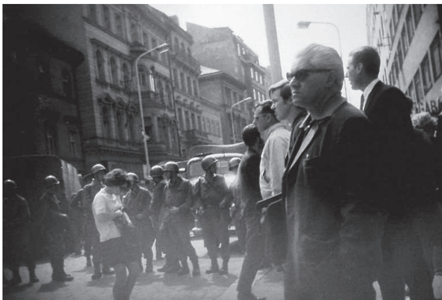
V pozadí tzv. uzávěra z příslušníků ČSLA v srpnu 1969 v Praze