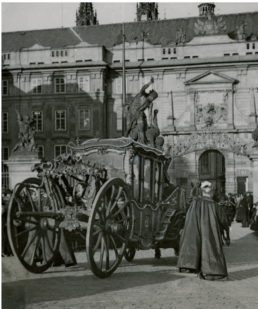
Zlatý kočár pražských arcibiskupů při vjezdu na Pražský hrad, 13. 4. 1936