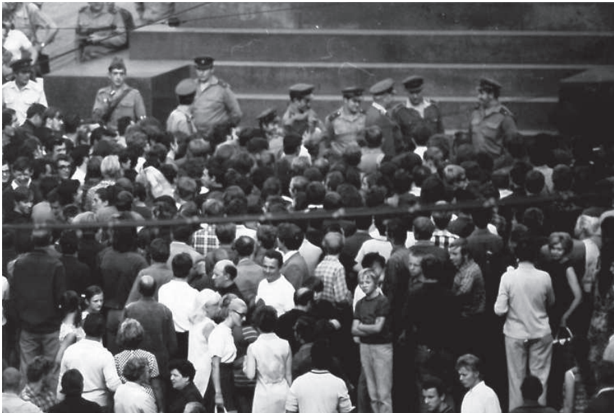
Fotografie zasahujících příslušníků VB, LM a ČSLA v srpnu 1969