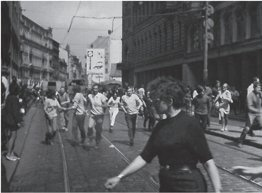
V pozadí zátaras pražské ulice z vojenských vozidel