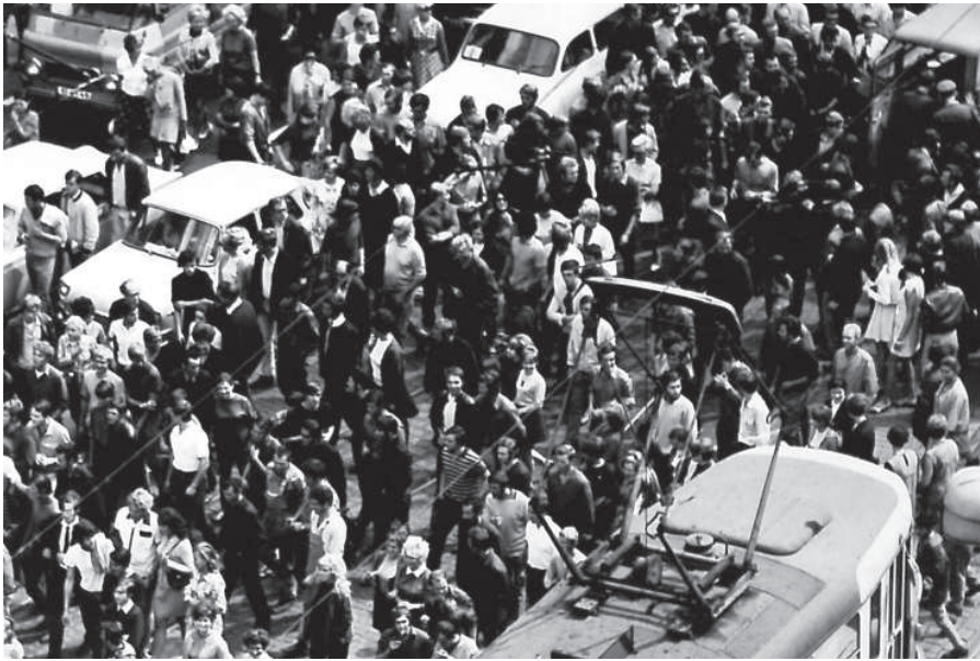
Srpen 1969 v pražských ulicích – ilustrativní fotografie