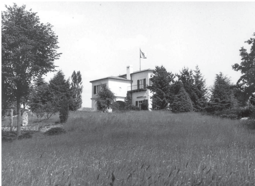
Vila v Sezimově Ústí v den prezidentovi abdikace, 7. 6. 1948

byly učiněny “. 61 V Praze při oslavách 600. výročí založení Karlovy univerzity pronesl Beneš svůj poslední projev ve funkci prezidenta a také si ověřil, že se mu u Gottwalda nepodařilo prosadit návrat propuštěných vysokoškoláků. Represe pokračovaly a Beneš si uvědomoval, že jeho setrvání v úřadě nic nevyřešilo, navíc měl jako hlava státu podepsat novou ústavu, plnou všeobecných formulací, ale ve skutečnosti chudou na záruky občanských svobod a práv. Ústava 9. května navíc uzákoňovala převzetí moci dělnickou třídou. Gottwald se sice usilovně snažil získat prezidentův podpis, ale to se mu nepodařilo. Dne 7. června 1948 Edvard Beneš na úřad prezidenta republiky abdikoval.