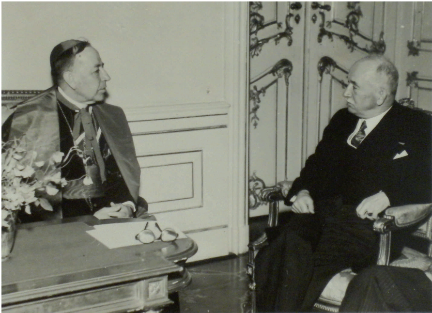
Rozhovor S. Rittera a E. Beneše po předání pověřovacích listin, 18. 6. 1946 (Archiv MZV (dále AMZV), Diplomatický protokol, 1945-1955, k. 56)