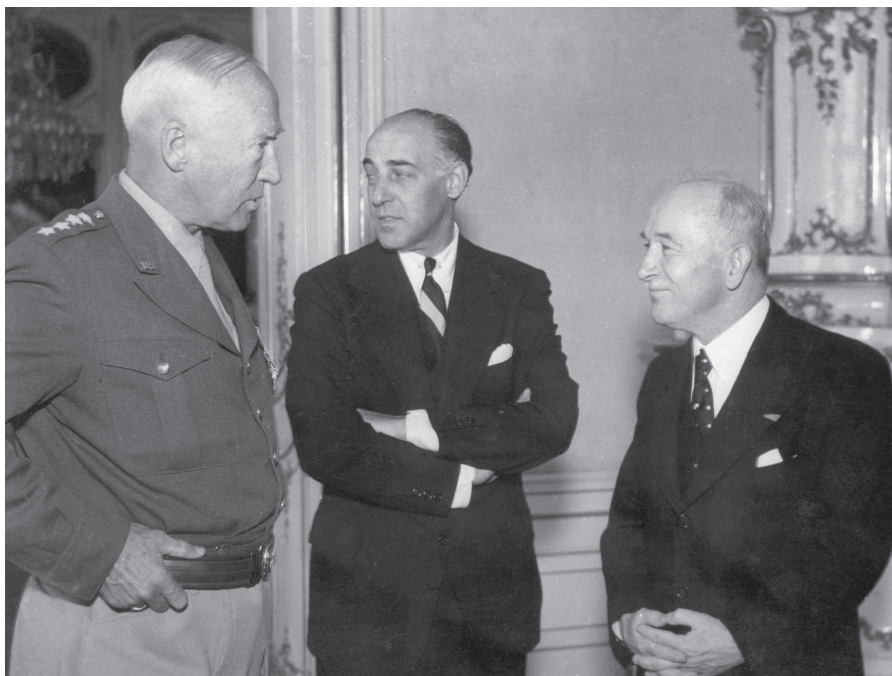
Na Pražském hradě v rozhovoru s gen. Georgem S. Pattonem a americkým velvyslancem Laurencem A. Steinhardtem, 27. 7. 1945

Mezi nejdůležitější dekrety, které Beneš před svoláním Prozatímního Národního shromáždění parafoval, náležely mimo jiné dekrety znárodnovací. O nich prezident hovořil s americkým velvyslancem Laurencem A. Steinhardtem, jemuž sdělil, že „ dekrety byly mnohem více širší, než si přál ... udělal všechno, co mohl, aby omezil jejich rozsah ... nebyl ale schopen zbrzdit radikály, aniž by vyvolal otevřenou roztržku “, předpokládá však, že „ bude muset dojít k závažné modifikaci programu znárodnění při jeho realizaci “. Beneš si byl podle Steinhardtta vědom, že „ musel být učiněn závažný ústupek radikálům, aby se vyvaroval nebezpečí komunismu “. 11