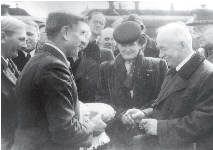
Uvítání Edvarda Beneše a jeho manželky Hany v Humenném, 3. 4. 1945

vých střeoevropských vlád se jednalo o jediný emigrační kabinet, kterému to Sovětský svaz umožnil. Po jeho sestavení, dojednaném v Moskvě, však s hlavou státu necestoval tým prodchnutý jednotným duchem a vůlí. Komunistický politik a ministr Václav Kopecký o mnoho let později vzpomínal, že se tehdy vracela „v jednom vlaku dvě ‚mužstva‘ politických činitelů“, jedno vedené Gottwaldem a druhé v čele s Benešem, která očekávala, že „doma se vybojuje konečné utkání“. 2