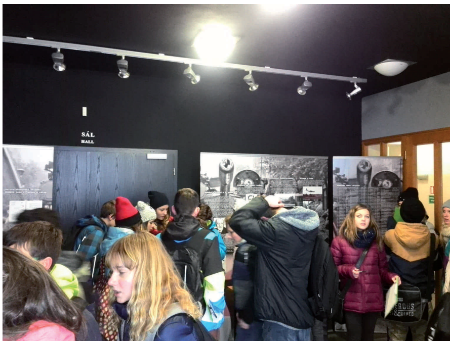
Výstavu můžete do 12. 1. 2015 vidět ve vstupní hale Památníku Vojna u Příbrami

Jak jsme se mohli ve sborníku č. 2 věnovanému Dr. E. Benešovi pochlubit, výstavu Nejdelší noc – 21. 8. 1968 navštívilo k 11. 9. 2014, kdy výstava končila v Husitském muzeu v Táboře, již 58 122 občanů. V Ostravském muzeu, kde se prezentovala ve dnech 18. 9. – 26. 10. 2014 k nim přibýlo dalších 780 osob, takže se začínáme blížit k 60 000! Možná se tak stane ještě letos v Památníku Vojna u Příbrami, kam se osm panelů přestěhovalo v pondělí 3. 11. 2014 a zůstanou zde do 12. 1. 2015, nebo v Benešově v tamní pobočce Státního oblastního archivu Praha, kde si ji zájemci mohou prohlédnout od 13. 1. do 13. 2. 2015. Další zastávkou pak může být zrovna Vaše město, stačí, když se nám ozvete na udv@pcr.cz .