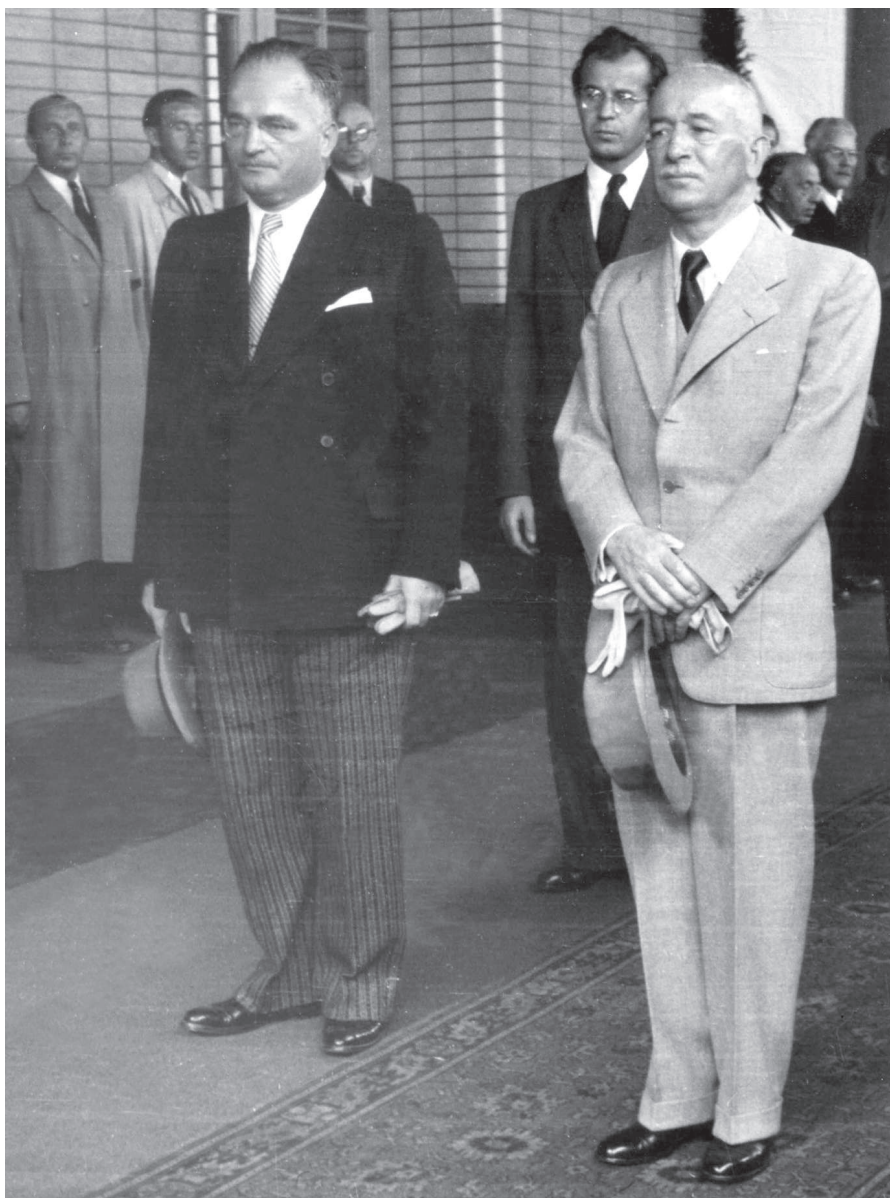
V Bratislavě s předsedou Slovenské národní rady Jozefem Lettrichem a zároveň předsedou Demokratické strany, v pozadí předseda Sboru pověřenců Gustáv Husák, 8. 9. 1946