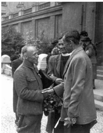
Po návratu z koncentračního tábora