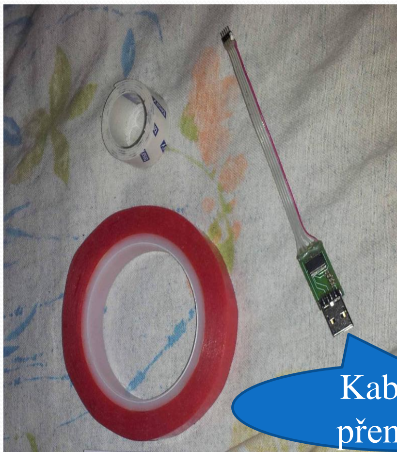
Kabel pro přenos dat