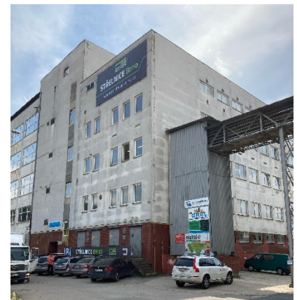
Budova střelnice je dobře značená a jde vidět už z dálky.