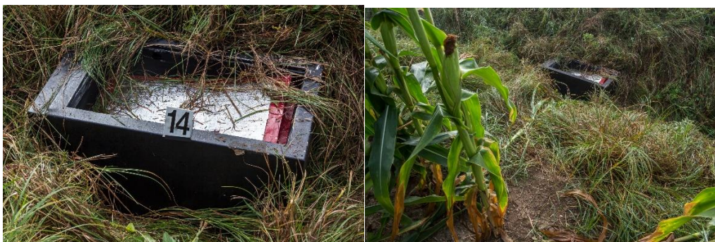
Foto nalezeného trezoru.

Aplikace po letošní aktualizaci přináší nově informace k používání trezorů a mechatronických zabezpečovacích zařízení. O tom, že lze trezory používat i zcela nevhodně by mohli vyprávět kriminalisté. Nedostatečně zajištěné trezory v objektu bývají paradoxně „službou“ pro pachatele krádeží a majetek ochránit nedokáží. Výjimkou není odcizení celého trezoru a jeho následné pohazení např. v lese poté, co si pachatelé opatří nástroje na jejich překonání. Z uvedených důvodů je nutné myslet na vhodné ukotvení trezoru.