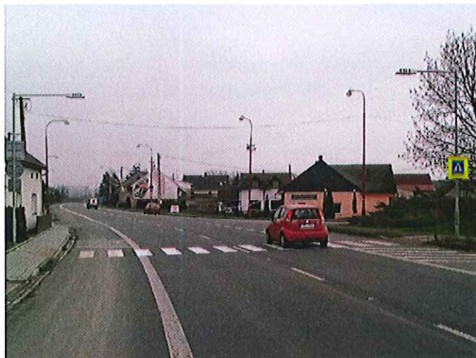
5) v obci Kokory na silnici č. I/55