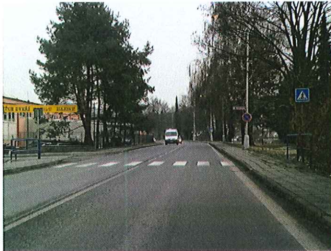
3) v extravilánu za obcí Hranice u vlakové stanice Teplice nad Bečvou na silnici č. I/35