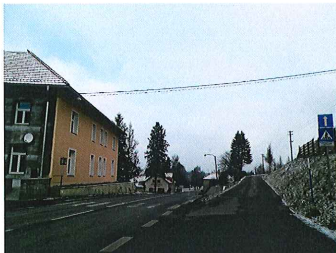
2) 6x v obci Hranice na silnici č. I/35